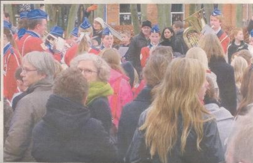
Værløse Garden trak op i skolegården og spillede fødselsdagsange.

Værløse nyt tirsdag den 16. december 2008