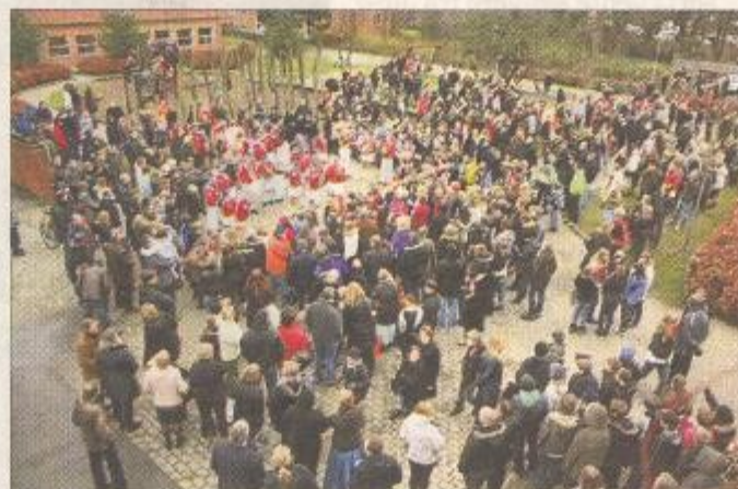
Elever, lærere og forældre var samlet for at høre Værløse Garden.