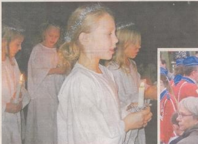
Når nu det var den 13. december, skulle det selvfølgelig være Lucia-optog.

Festlig dag, da Hareskov Skole holdt 90-års fødselsdag